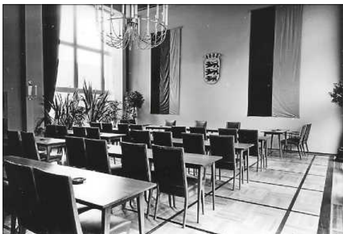
Blick in den Sitzungssaal des Landratsamtes damals ...

Der Haupteingang des Landratsamts befindet sich auf der Rückseite, da ursprünglich geplant war, die westliche Bahnhofoberführung zu verlängern und hinter dem Landratsamt enden zu lassen. Die Stadt Pforzheim realisierte diesen Plan leider nicht.