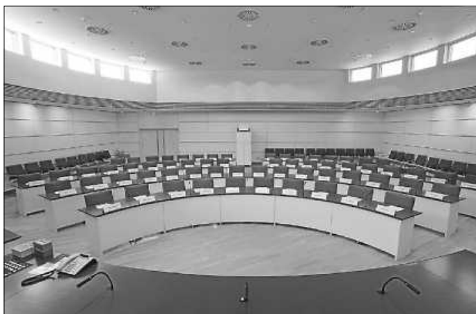
.... und heute.