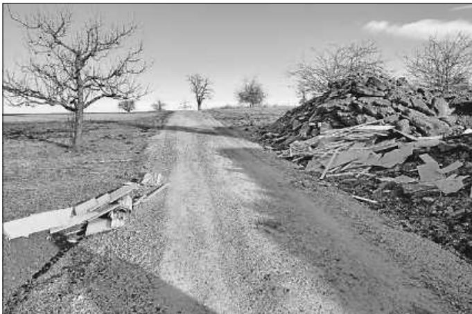
Müllablagerung westl. NBG Frischegrund