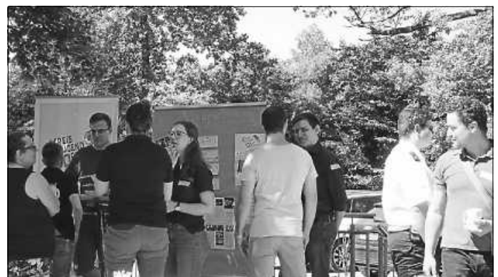
Markt der Verbände