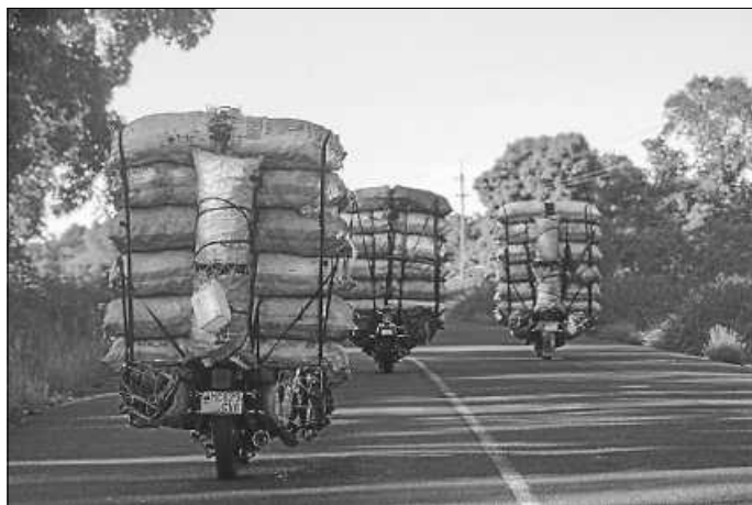
Illegale Holzkohle-Transporteure bevorzugen Motorräder, da es viel einfacher ist, Behörden und Straßensperren zu entkommen.

Der tansanische Fotograf Imani Nsamila begleitet in seiner ergreifenden Dokumentation den zumeist illegalen Prozess der Baumrodung und Kohleherstellung bis hin zum verkaufsfertigen Kohleprodukt für den Markt. Das Ausmaß dieses naturfeindlichen Prozesses, der dennoch viele Arbeitsstellen im Land sichert, wird durch die Bilder deutlich und verlangt nach einer nachhaltigen Alternative für die Erhaltung des Klimas. (enz)